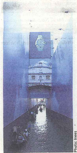
Le pont des soupirs à Venise

Die „Action Sociale pour Jeunes“ wurde in den 80er Jahren gegründet, zu einem Zeitpunkt, als die Jugendarbeitslosigkeit in Luxemburg einen alarmierenden Stand erreichte. Aufbauend auf den nationalen und internationalen Erfahrungen ihrer Mitglieder machte sie Weiterbildung und lokale Entwicklung zu ihren Hauptthemen und trug somit ihren Teil dazu bei, dass diese Bereiche bei der Bekämpfung der Arbeitslosigkeit Berücksichtigung fanden. Im Laufe der Jahre erweiterte die ASJ ihre Interventionsgebiete mehr und mehr und musste in ihrer Struktur angepasst werden. Dies führte 1998, in Zusammenarbeit mit dem OGBL, zur Gründung von Objectif Plein Emploi.