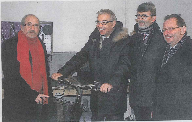
De Vélo-Locationssystem Vël'Ok!, deen de CIGL Esch 2004 initiéiert hat, gouf d'lescht Joer komplett erneiert