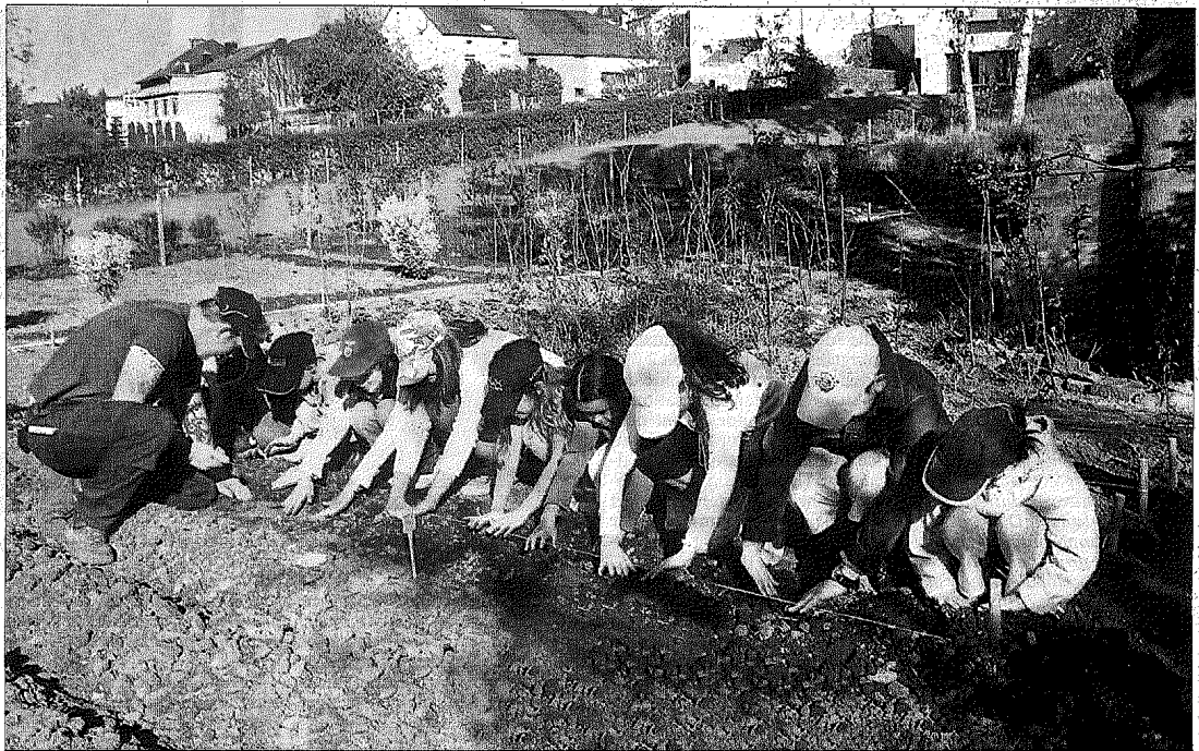
Qui se soucie de regarder la fleur de la carotte sauvage au temps des cerisiers? Sodo, Haiku (poème japonais)

Cette année, nous avons enrichi le programme par la comédie, en y associant „le aux clowns“, un projet du réseau Objectif Plein Emploi que le CIGL Hesperange